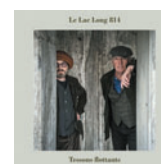
LE LAC LONG 814 Tessons flottants (Comedia) 17 titres • 2021 Obs. : Magali chante et joue du violon sur La moirure du lac.