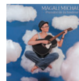
Prendre de la hauteur (Autoproduit) 16 titres • 2026